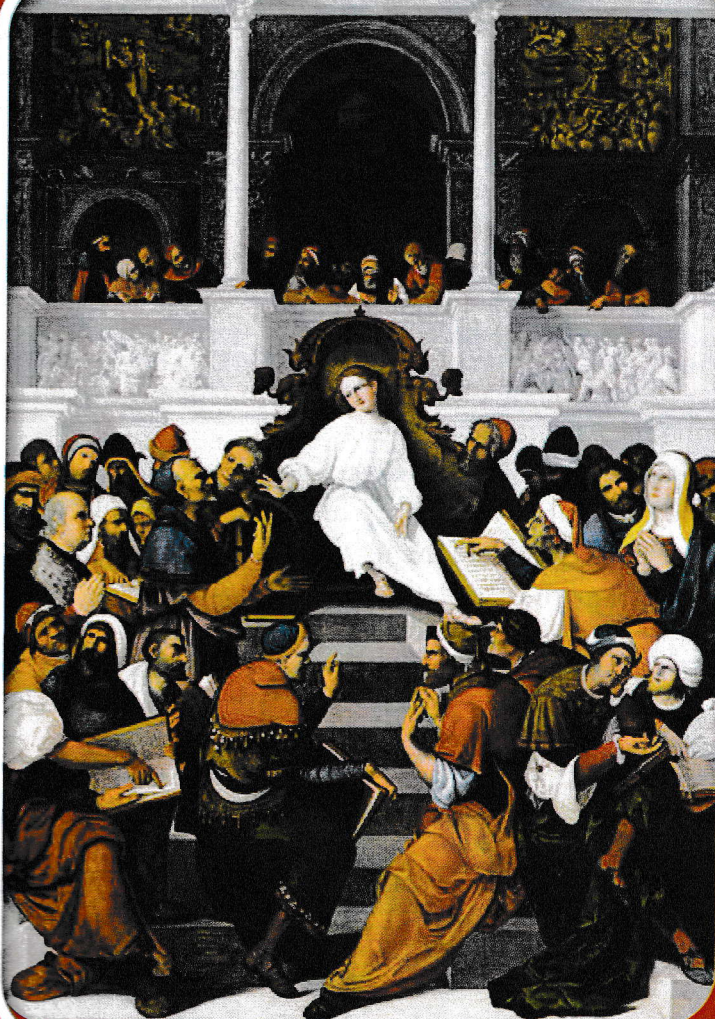
„Isus învățând în templu la 12 ani”, tablou de Ludovico Mazzolino (1480–1528)